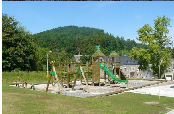
Espaces de jeux