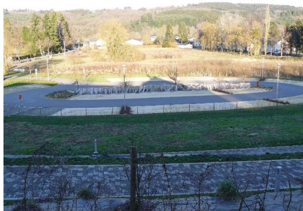
Phase III - Abords