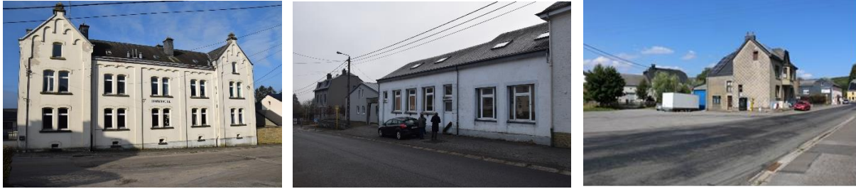
Les trois derniers projets en cours ou en attente du PCDR 2010-2020