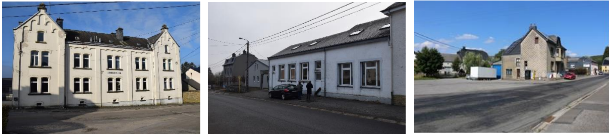
Les trois derniers projets en cours ou en attente du PCDR 2010-2020