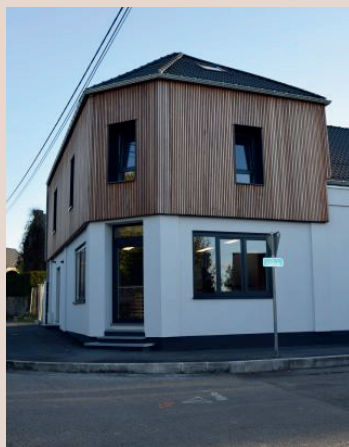
LE MERBIEN, MAISON DE VILLAGE À MERBES-SAINT-MARIE