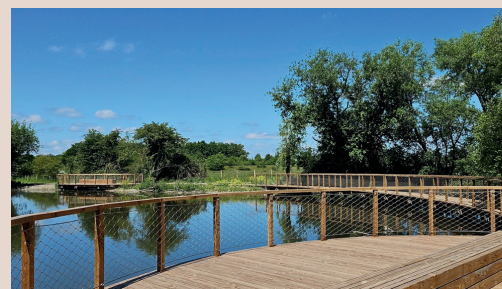
ETANG DU GRAND BU À DOISCHE