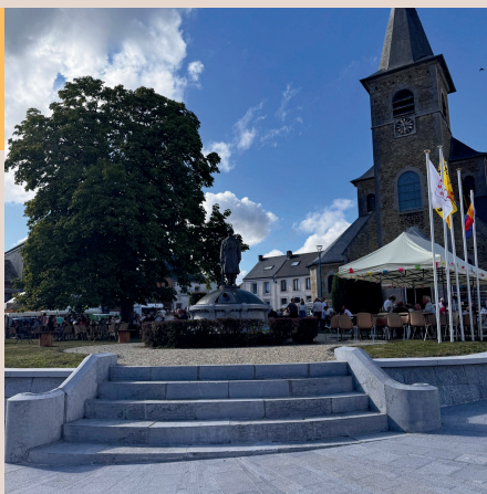
PLACE DE SIVRY-RANCE